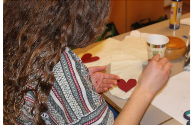
Hjertedekoren festes til «vottedelen» med spraylim, og sys fast før votten sys sammen.