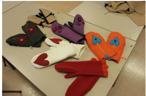
Resultatet var 6 par flotte votter...