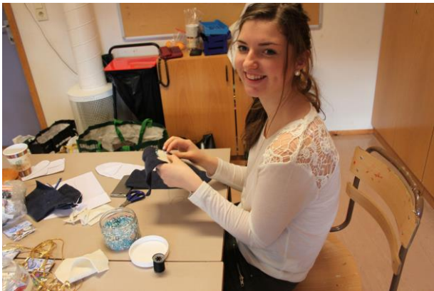
Guro syr på perler rundt hjertet...