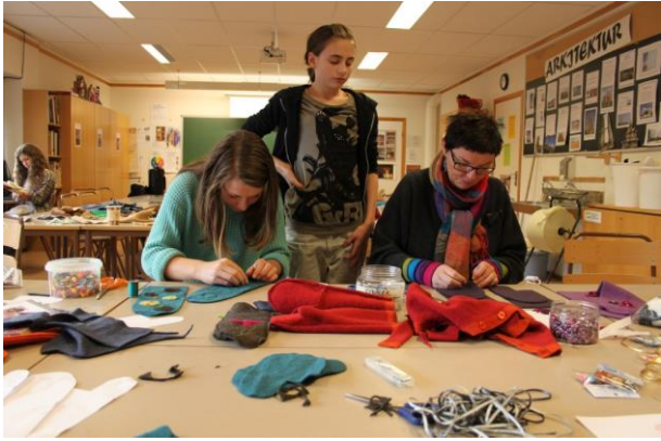
De to delene på undersiden av votten, sys sammen først.