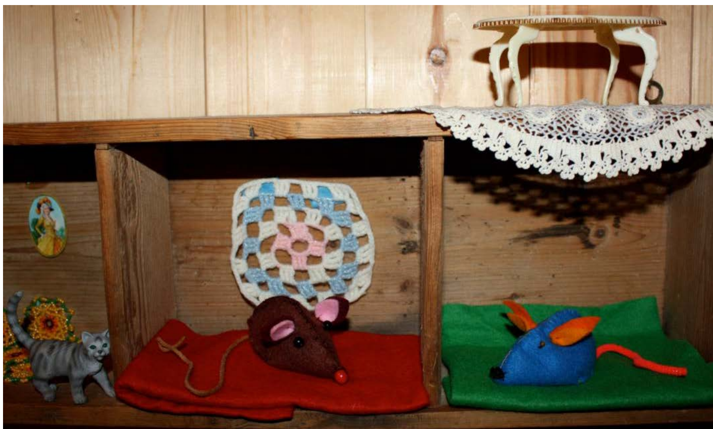
Oppskrift og foto: Kristine Fornes, modeller: Venil